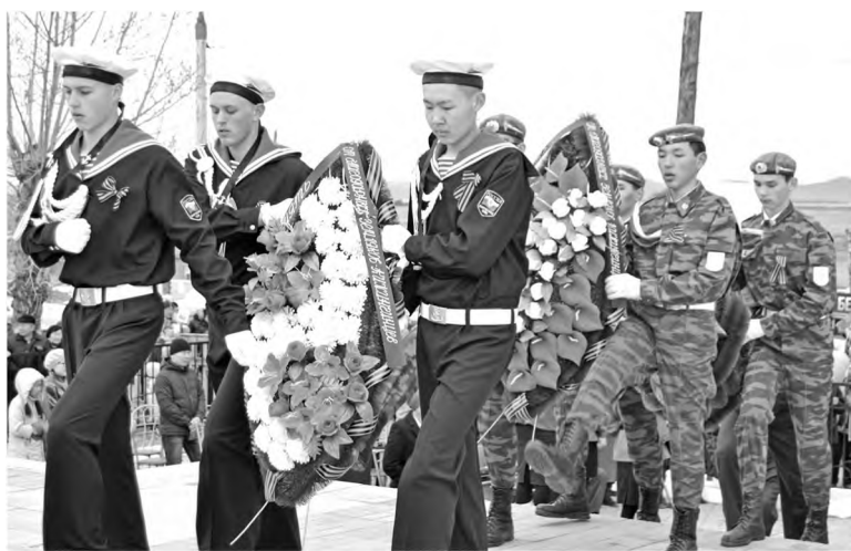
Победе и мн.др.

У нас в этот день пройдет праздничная патриотическая акция «Взвейся, священное знамя Победы!». Пройдет трансляция на Центральной площадке голоса Левитана, песен военных лет, патриотическая музыкальная акция «Победный май», почетный караул на Аллее Славы, мкр. Хухэ-Добо, Ленинзам, Минута молчания, возложение венков к Памятнику воинам-землякам, музыкальная акция «Окно Победы» и вечерняя акция «Фонарики Победы», в социальных сетях проходят акции «Рисунки Победы», различные челленджи, где жители читают, поют о Великой